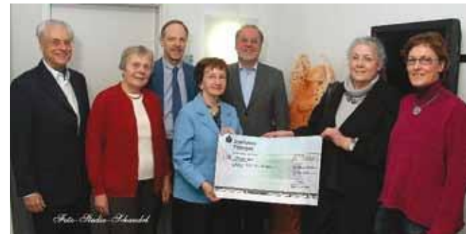
Von oben nach unten: 2007 - Empfang im Kurhaus Waldbronn Spendenübergabe 2008 Spendenübergabe 2009 im Rathaus Karsbad