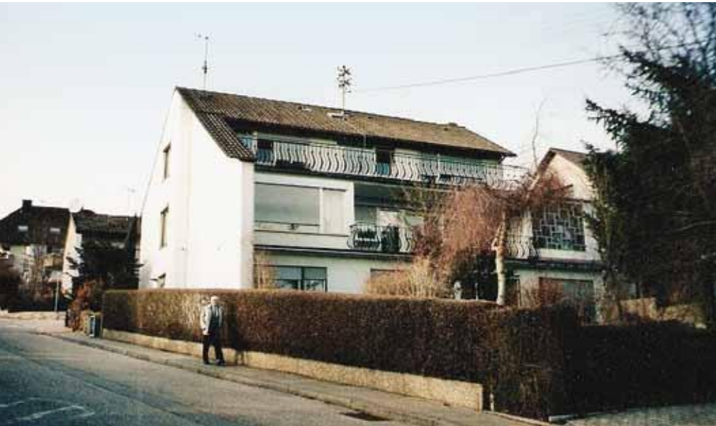
1998 - 2006: Das „Sonnenlicht“ in Karlsbad-Auerbach ist eines der ersten stationären Hospize Deutschlands.

Hier wurden schwerkranke und sterbende Menschen aus dem ganzen Landkreis als Gäste, unabhängig von ihrer Weltanschauung, kostenfrei aufgenommen. Viele