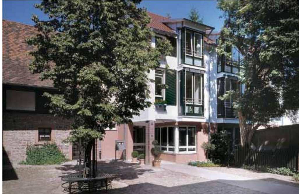
Im Sommer 2006: Das Hospiz „Arista“ - Blick auf den Eingangsbereich und den Hof.

Mit vielen Veranstaltungen und Aktionen hatten die Mitglieder des sehr aktiven Fördervereins „Hospiz Ettlingen e.V.“ um Spenden geworben und durch den Verkauf unzähliger „Bausteine“ für 1 Euro eine stattliche Summe gesammelt. Außer einem vorhandenen Vermächtnis sowie einem zinslosen Darlehen der Krebsstiftung halfen Kliniken, kirchliche Institutionen, Rotary-Clubs und Stiftungen sowie der Landkreis, die Städte Karlsruhe und Ettlingen, vor allem aber zahl-